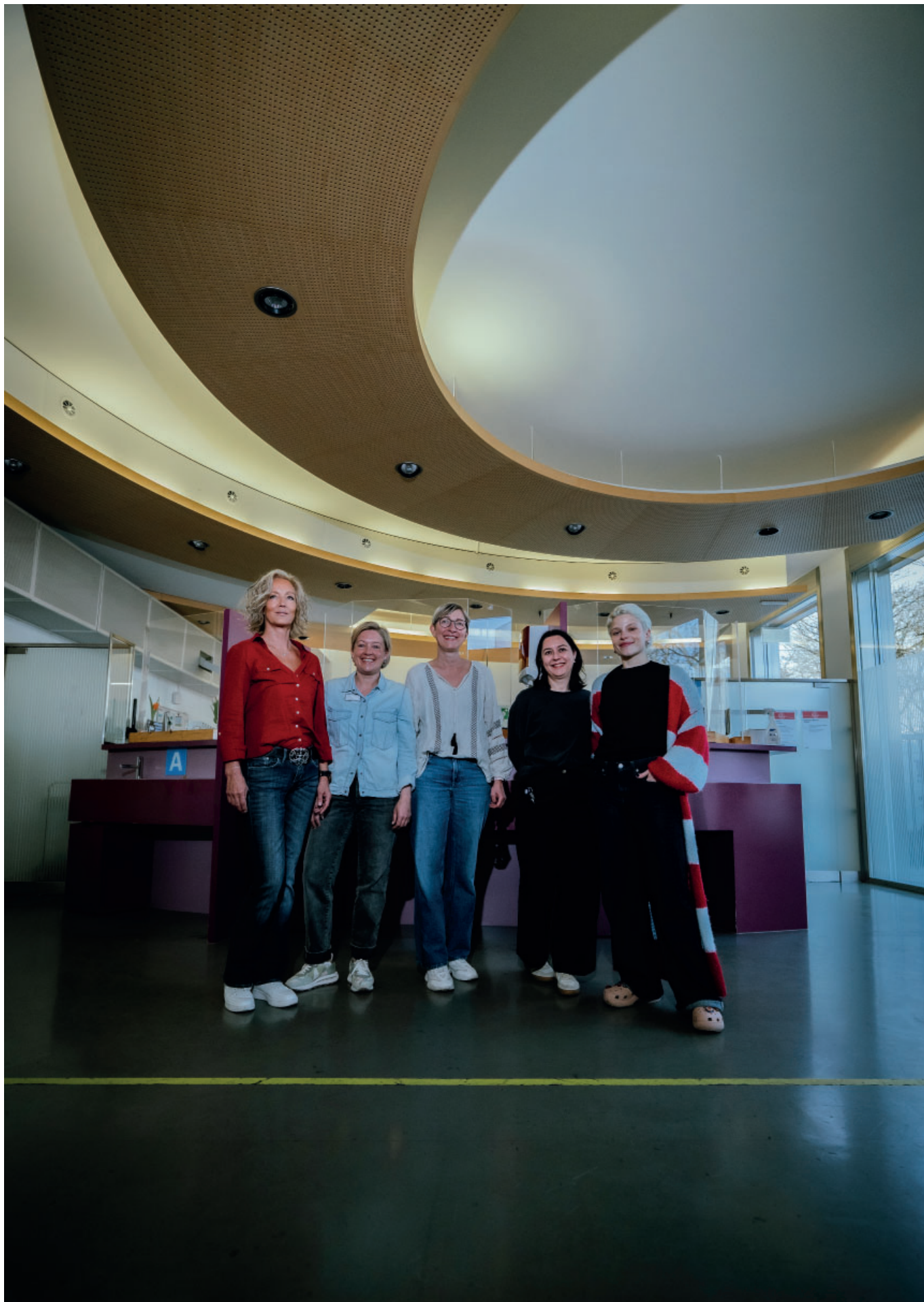
Die Bildserie dieser Ausgabe rückt die Fachpersonen der Suchtarbeit ins Zentrum. Porträtiert werden Mitarbeitende aus drei Institutionen. Auf dem Foto: Mitarbeiterinnen Arud Zentrum für Suchtmedizin.